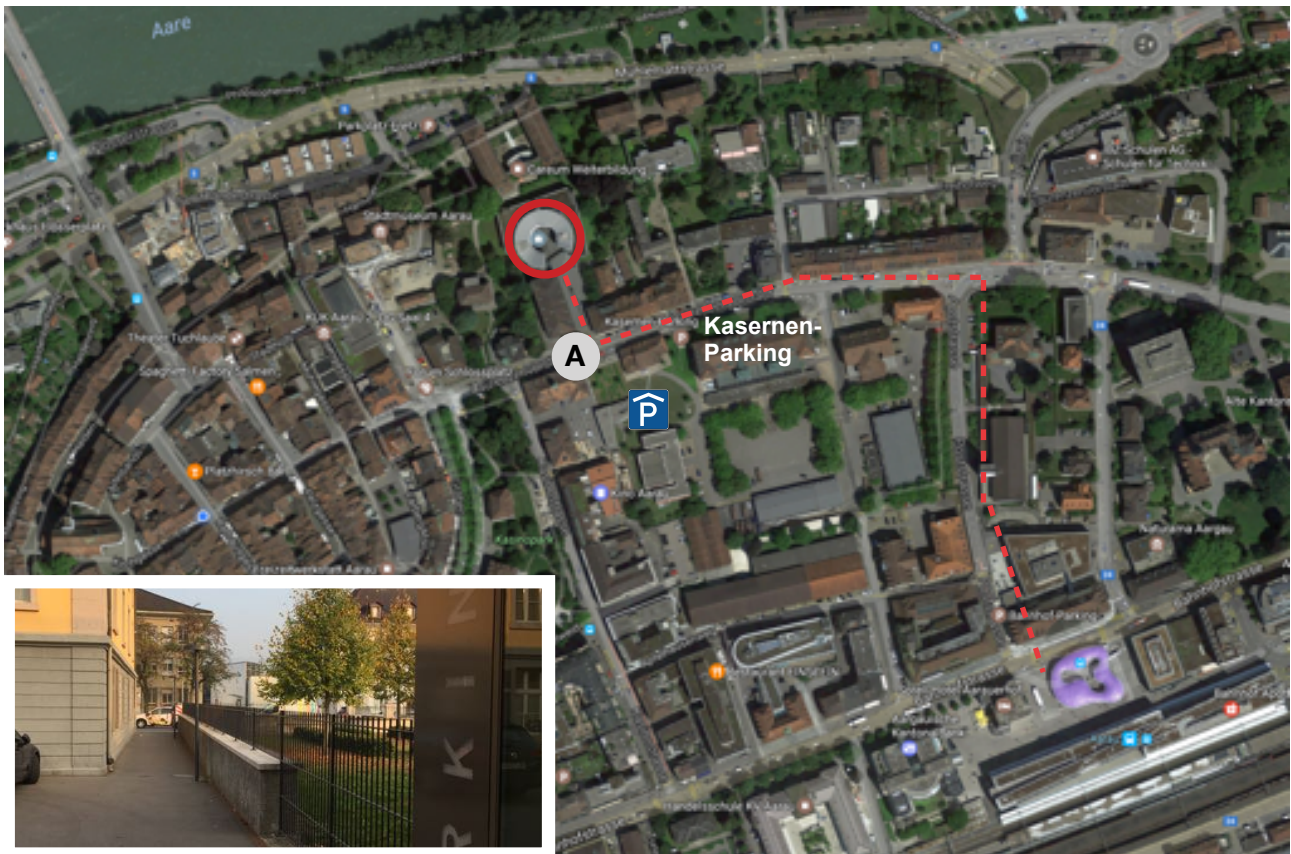
Blick vom Parkhaus Ausgang Richtung Norden

Der Parkings-Beschilderung "Kaserne" folgen. Der Personenausgang befindet sich auf der südlichen Seite der Laurenzenvorstadt. Von dort nach Norden über die Strasse.